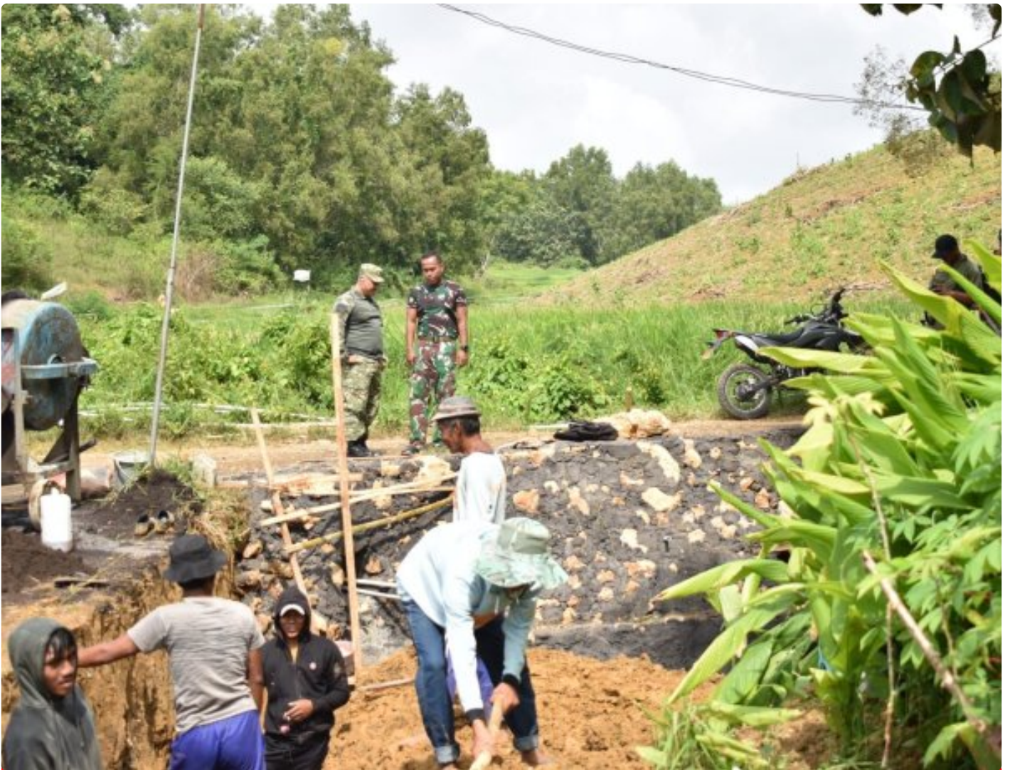
Dansatgas TMMD 127 melihat progres pembuatan TPT didampingi Lettu Arh Kumam di desa mandala

SUMENEP - Komandan Satuan Tugas (Dansatgas) TNI Manunggal Membangun Desa (TMMD) ke-127 Tahun Anggaran 2026 Kodim 0827/Sumenep, Letkol Arm Bendi Wibisono, S.E., M.Han, meninjau langsung progres pembangunan di Desa Mandala, Kecamatan Rubaru, Kabupaten Sumenep, Senin (16/2/2026).